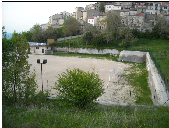
La paratia di pali che protegge il campo dalla frana de i "Fossi" in realtà obbliga il campo a 50 mt di larghezza e per il campionato di Promozione la larghezza deve essere di 60 mt