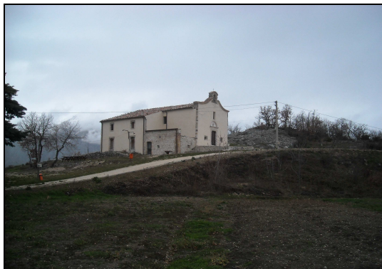
Esterno ed interno del Santuario

Però, durante la festa, si sa, si mangia, si beve e ci si mette un po' brilli; quindi era un po' rischioso riportare i santi a Torricella dopo i fuochi d'artificio. Allora si decise di riportarli la sera, subito dopo la celebrazione del Vespro, in modo che i Torricellani potessero festeggiare tranquilli e anche bere qualche bicchiere di troppo.