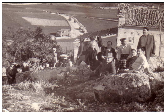
19 maggio 1953, le famiglie di Cianghette e di Canilore alla festa della Madonna delle Rose in procinto di fare la "scampagnata" dopo aver guadagnato un posto sulle rocce.