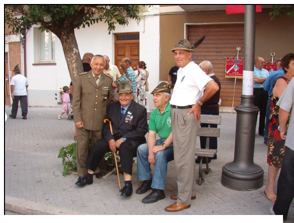
Agosto 2007, una pausa dell'adunata degli alpini a Torricella Peligna in occasione del 60° anniversario della locale sezione