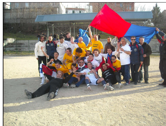
29 marzo 2009, il giorno della matematica vittoria, con 4 giornate di anticipo, del campionato di I° categoria,